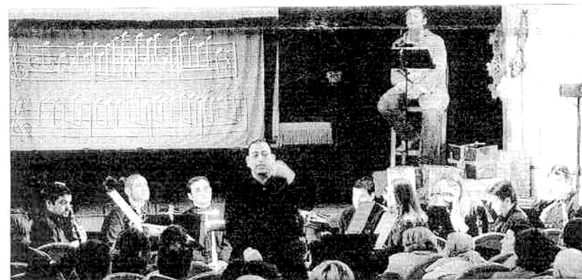
El Teatro Apolo se vistió de cumpleaños y vivió un lleno absoluto en el concierto didáctico.

en la corte de Salzburgo, su matrimonio y la posterior muerte de su mujer, los encargos de las grandes óperas... El narrador-actor Jesús Herrera relataba la historia y los niños no dejaban de exclamar y preguntar sobre los personajes y fragmentos musicales. Una pantalla sobre el escenario proyectaba imágenes de la vida del músico vienes complementado así la fantástica narración.